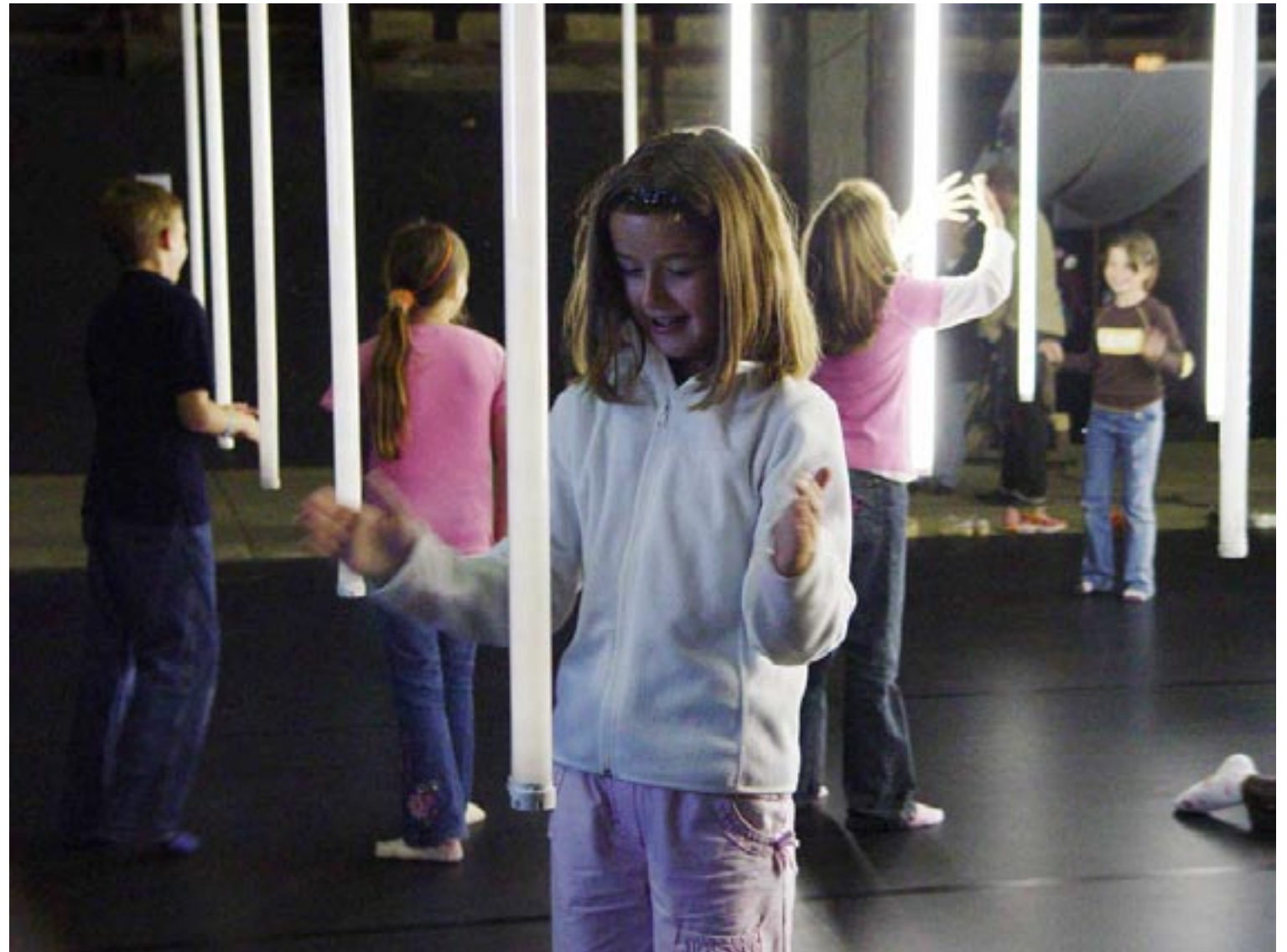
forest 2 - Installation - Kunstfest Weimar 2007